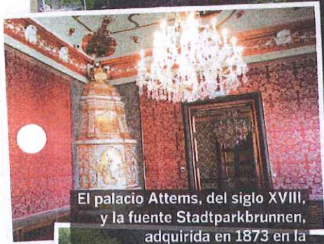
El palacio Attems, del siglo XVIII, y la fuente Stadtparkbrunnen, adquirida en 1873 en la Exposición Universal de Viena.

La torre de Uhrturm fue construida en 1561 en la colina de Schlossberg. Desde allí hay unas vistas espectaculares.